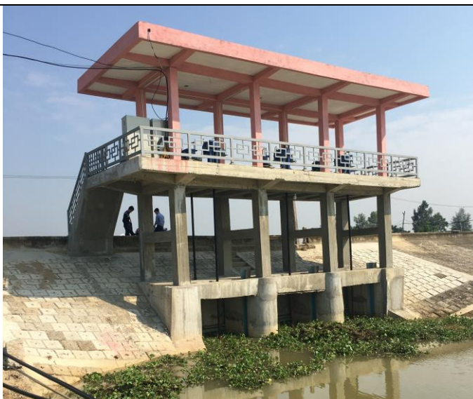
Hạ lưu công sửa chữa năm 2019

- Để đảm bảo an toàn cho người và thiết bị vận hành khi có mưa bão xảy ra năm 2020 Công ty xây dựng tường gạch phía trên sàn thao tác.