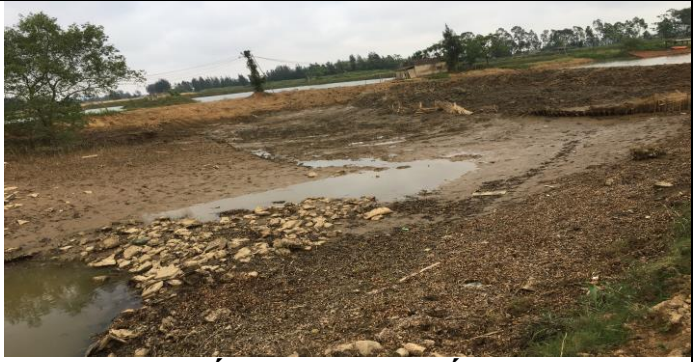
Hố móng hạ lưu cống

3 Một số hình ảnh trong quá trình thi công sửa chữa cống năm 2019