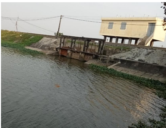
Thượng lưu công hiện nay