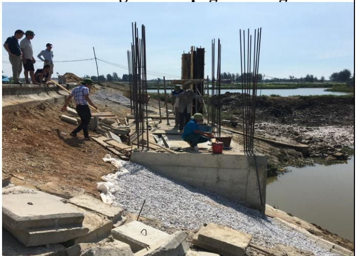
Thi công sản thao tác vận hành cống

Cống Ngọc Đình xây dựng từ năm 1962, quá trình khai thác sử dụng, vận hành cống tuân thủ đúng quy trình quy phạm, quy định hiện hành của Nhà nước, đảm bảo tưới tiêu, PCLB cho vùng Đông Nam huyện Hoằng Hóa.