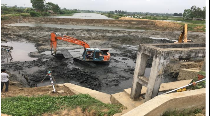
Hố móng thượng thượng lưu cống