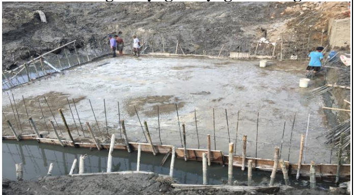
Thi công sân thượng lưu cống