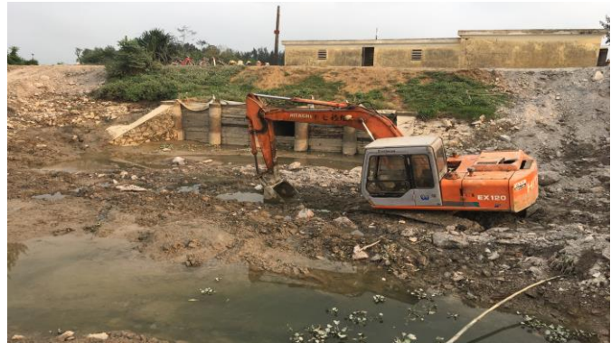
Hồ móng thượng lưu công