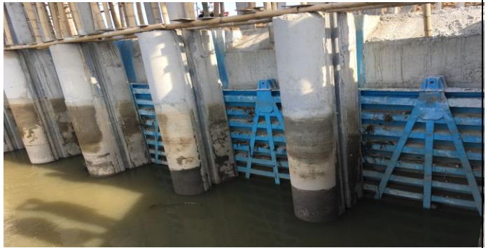
Ngăn lữ PCLB khi đang thi công