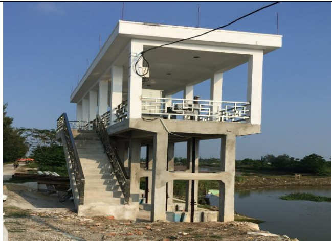
Hạ lưu công năm 2019

- Để đảm bảo an toàn cho người và thiết bị vận hành khi có mưa bão xảy ra năm 2020 Công ty xây dựng tường gạch phía trên sân thao tác bằng nguồn vốn sửa chữa thường xuyên.