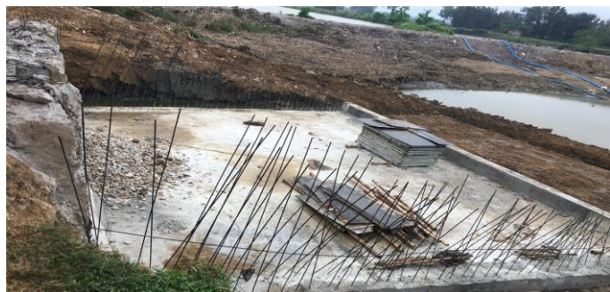
Thi công sân hạ lưu công