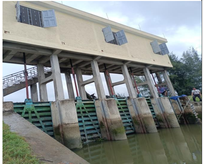
Hạ lưu công hiện nay