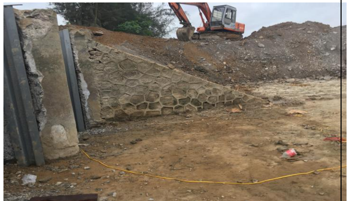
Thi công sân thượng lưu công