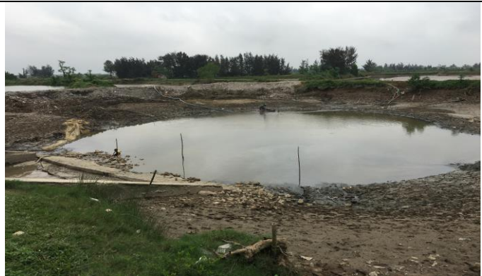
Hồ móng hạ lưu công

Một số hình ảnh trong quá trình thi công sửa chữa công năm 2019