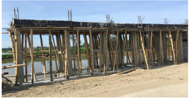
Thi công sàn vận hành cống

Cống Ngọc Đình xây dựng từ năm 1990, đảm bảo tưới tiêu, PCLB trên địa bàn huyện Hoàng Hóa, và 4 xã phường phía Bắc thành phố Thanh Hóa. Việc vận hành cống tuân thủ đúng quy trình quy phạm, quy định hiện hành của Nhà nước.